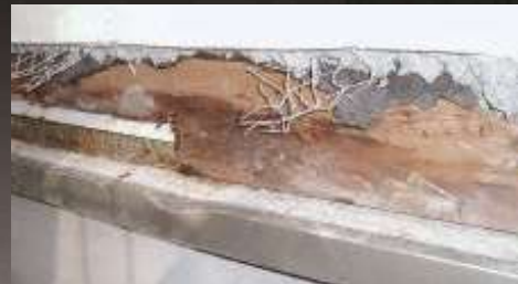
不適切な施工による水切の腐食事例 新築約1年半後にモルタルを取り除いた状態